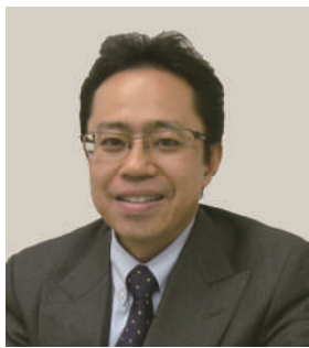
ファシリテーター： 一般社団法人 発明推進協会 研究員

大阪大学で原子力工学を学び、東芝で原子力プラントの設計業務に従事した後、知的財産部へ異動。弁理士登録後、社内弁理士として国内外出願手続き、契約、権利管理、知財教育業務に従事。東芝退職後、米国アイオワ州立大学大学院（経営学）へ留学し、帰国後、維新国際特許事務所（山口市、広島市）を設立。国際出願・外国出願を得意として広島・山口両県を中心に活動しており、昨年「維新知遊塾」を立ち上げて知的財産権を中心としたコラボセミナーの開催で奮闘中。