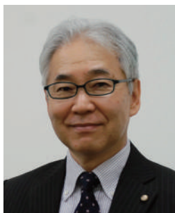
講師： 維新国際特許事務所 弁理士

経験豊富な講師陣との教材を活用したインタラクティブな進行により事業に生きる知財マネジメントの手法について深く掘り下げていきます。